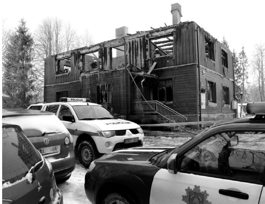
Namas Svėdasų girininkijoje stovėjo nuo 1961 metų. Jis neseniai buvo rekonstruotas.

Šeštadienio vidurnaktį Svėdasų seniūnijos Čiukų kaime, užsidegus Svėdasų girininkijos pastatui, ugnis nusinešė trijų miško darbininkų gyvybes.