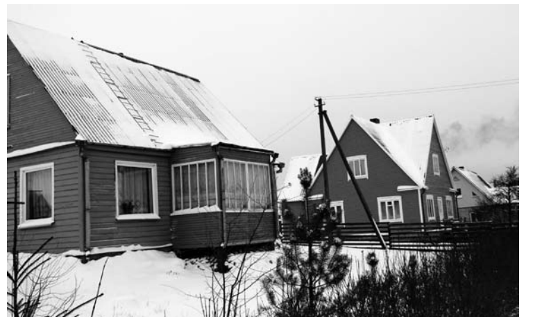
Puikios - šviesios ir gaivinančios žiemos vidurdienio ramybėje snaudžianti Ežero gatvė.